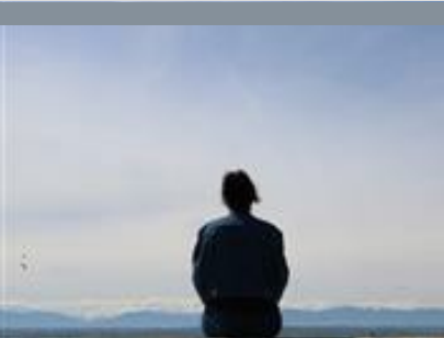
TABLE D'ORIENTATION DE RÉGADES

Profitez de l'espace culturel du village de Valentine : médiathèque et visite du salon Foch.