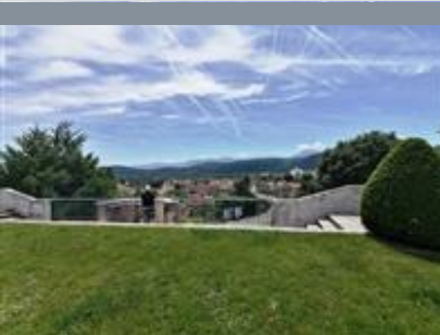
TABLE D'ORIENTATION DE SAINT-GAUDENS